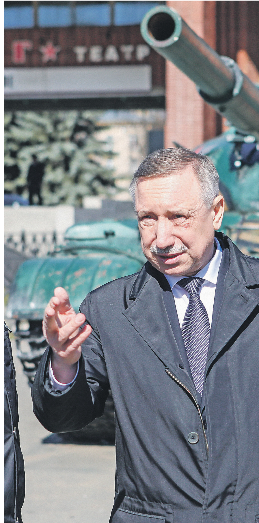
Одним из политиков, проявивших эмоциональную сопричастность в период избирательной кампании, эксперты ЭИСИ назвали губернатора Санкт-Петербурга Александра Беглова

“ Традиционные схемы и алгоритмы, исправно приводившие к победе в течение последних пятнадцати лет, перестают работать, причем даже в стабильных и предсказуемых регионах