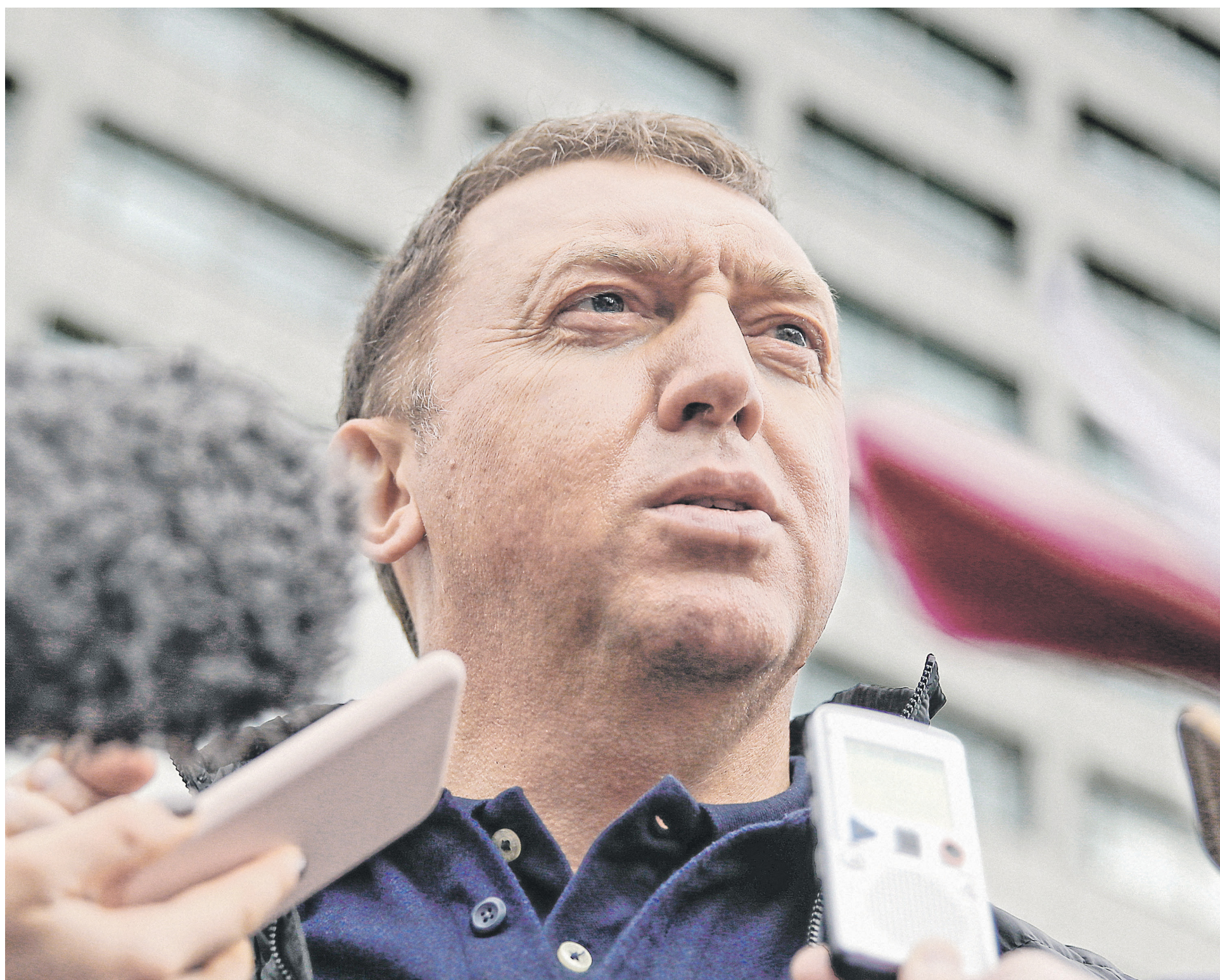
Прошение в OFAC о снятии санкций — часть юридической стратегии Олега Дерипаски наряду с продолжающимся судебным разбирательством против OFAC