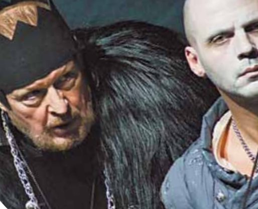
Сцена из спектакля «Гамлет»