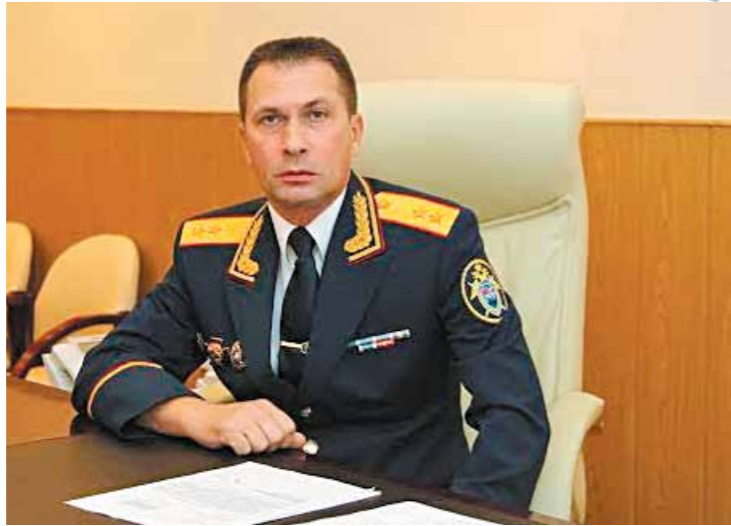
— В основном насильники — в 25% случаев это приезжие из стран ближнего зарубежья — нападают на малолетних детей. Нередки такие случаи и на дачных участках: родителей нет, дети остаются без защиты.

— Как часто это происходит, где, кто и каким образом нападает на детей?