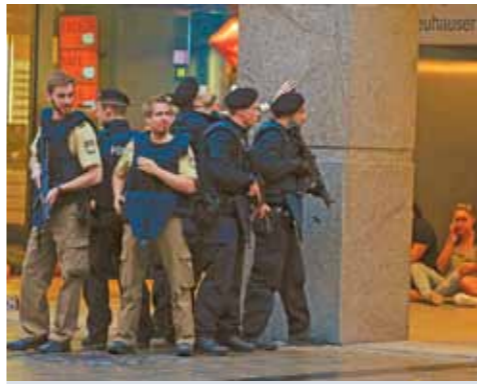
Спецоперация в Мюнхене длилась несколько часов.

местному времени он был найден мертвым на одной из улиц, прилегающих к торговому центру. По версии полиции, он совершил самоубийство. В пистолете и в рюкзаке злоумышленника оставалось порядка трехсот патронов.