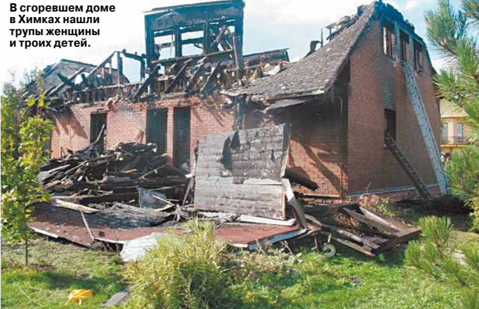
В сгоревшем доме в Химках нашли трупы женщины и троих детей.