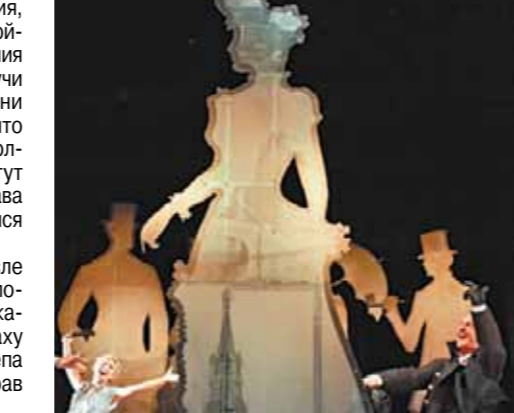
Сцена из спектакля «Гамлет»