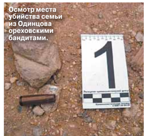
Осмотр места убийства семьи из Одинцова ореховскими бандитами.

— Расскажите, какие интересные новинки криминалистической техники есть на вооружении ГСУ?