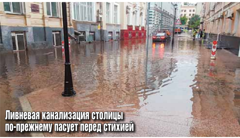
Ливневая канализация столицы по-прежнему пасует перед стихией

Положение усугубляется еще и тем, что ливневка в столице находится весьма в запущенном состоянии. По разным оценкам, коллекторы диаметром 1,5–2 метра в Москве засорены примерно на 50%, трубы поменьше — на 80. Некоторые трубы узкого сечения укладывались еще в 1940-е годы, когда нормативы по пропуску осадков были значительно ниже нынешних. В таких условиях спровоцировать засорение могут ветки, листья, любой попавший в стоки мусор. Современность добавила проблем в виде точечной застройки,