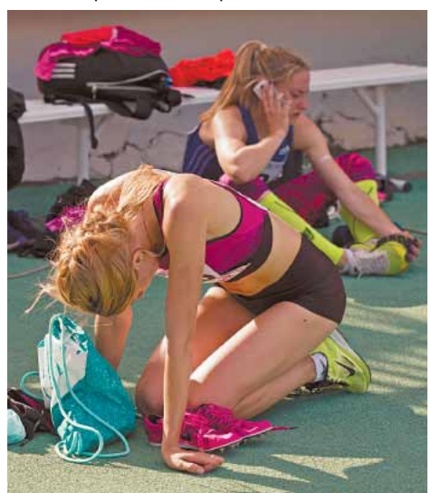
Трудные будни российского спорта.

Детали перестройки можно обсуждать, но контуры ее в общем и целом понятны: российский спорт должен находиться на несравнимо большей, нежели в настоящий момент, дистанции от власти и политической конъюнктуры. Возможно, для этого придется пожертвовать не только Виталием Мутко, но и всем Министерством спорта. В конце концов, большинство стран, которые принято называть цивилизованными, прекращают обходиться без такой бюрократической структуры. Да и наша страна до 2008 года как-то обходилась. Да, на Олимпиадах тогда мы получали меньше медалей, чем в Сочи, зато репутацией российского спорта больших проблем не было.