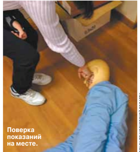
Поверка показаний на месте.

процессов по преступлениям «ореховских», киллеры действовали по приказам, которые передавались по цепочке от руководителей банды: убивали свидетелей, потерпевших и адвокатов, выступавших против банды, и тех, кто отказывался платить бандитам.