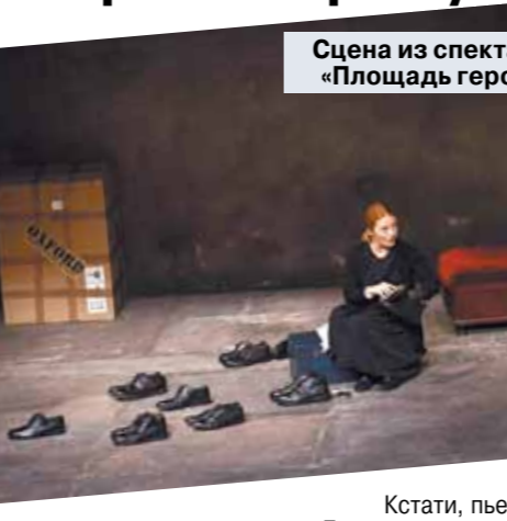
Сцена из спектакля «Площадь героев».

Но лидером зрительского успеха, безусловно, является спектакль «Площадь героев» («Place des heros») в постановке знаменитого поляка Кристиана Люпы с артистами Литовской национальной драмы. Последнюю пьесу Томаса Бернхарда играют далеко за пределами старого Авиньона, в Ведене, но дальний путь никого не смущает. «Площадь героев» Бернхард написал за год до смерти. Ее действие происходит спустя полвека после речи Гитлера в Вене в 1938 году. Постановка пьесы в венском Бургтеатре в свое время вызвала немалый скандал. Она еще не была опубликована, а перед театром уже проходили митинги против нее. Оно и понятно: взгляды автора и официальных властей на роль Австрии во Второй мировой, на отношение к нацизму, антисемитизму диаметрально расходились. Достаточно сказать, что в своем завещании писатель запретил издание и постановку своих текстов на родине.