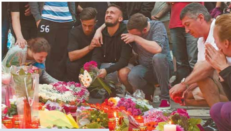
Жители города несут цветы и свечи к торговому центру, где разыгралась трагедия.

Вскоре после начала стрельбы вооруженный пистолетом нападавший был легко ранен прибывшими на место преступления полицейскими в штатской одежде. Позже стрелку удалось скрыться с места события, но около 20.30 по