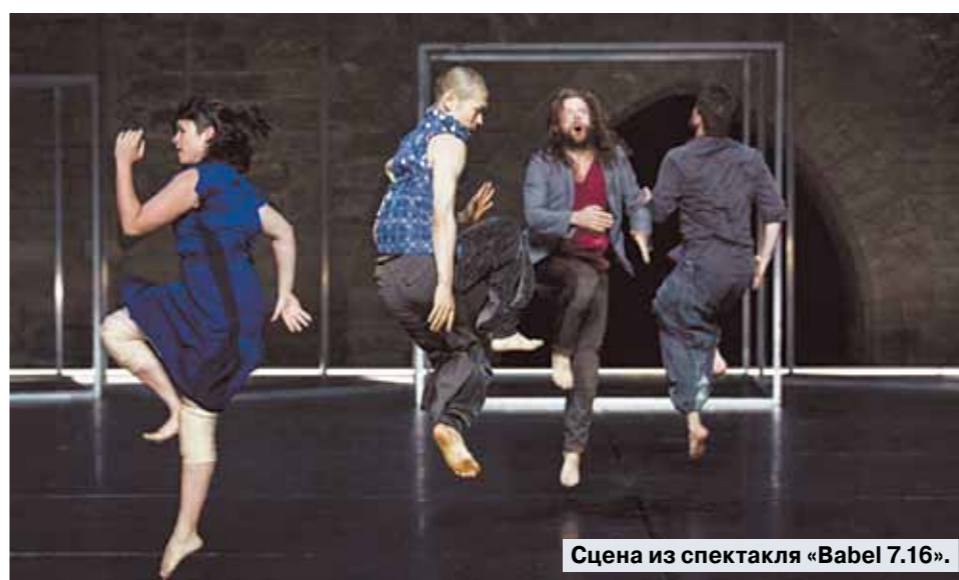
Сцена из спектакля «Vabel 7.16».

Совсем другая камера у чилийского режиссера Марко Лайера в спектакле «Диктатура хиппи» («La dictature du cool») — темпераментная, горячая. Но... не она звезда, а то, что в фокусе, — поколение новых интеллектуалов (кураторы, критики, эксперты, перформеры), самодовольная богема, навязывающая обществу свой вкус. В Чили эта категория получила название «Бо-Бо». Впрочем, Лайер считает, что этот класс прежде всего присутствовал в США и во Франции, но социальная группа с идентичными чертами и ценностями существует и в других странах, хотя называется иначе. «Как бы они ни назывались, их цель гуманизировать капитализм и построить реальный повседневный утилитаризм», — считает режиссер.