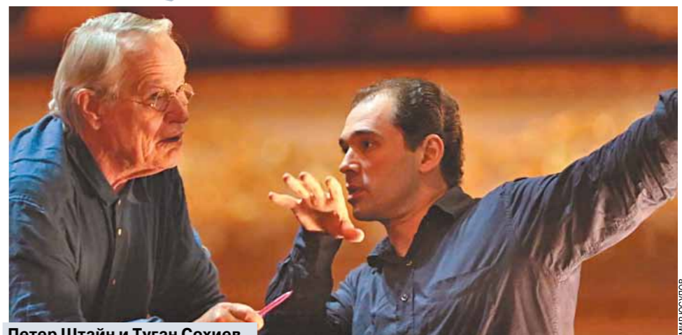
Петер Штайн и Туган Сохийев.