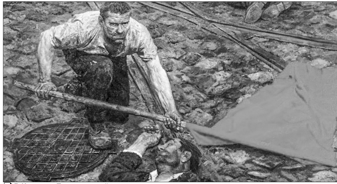
Г. Коржев. «Поднимающий знамя».