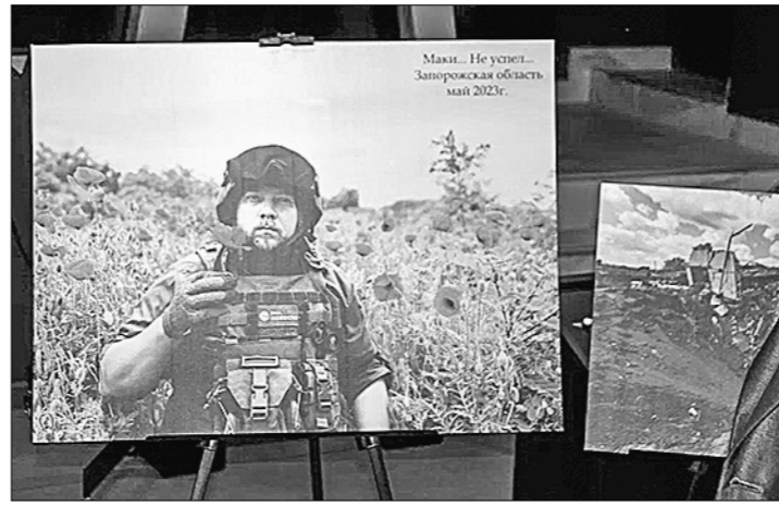
имя нашей партии, нашей Родины, нашего народа».

— не пустой звук, а высокое звание, которое необходимо опрашивать. И они его оправдали, как и другие наши товарищи, отдавшие свои жизни во