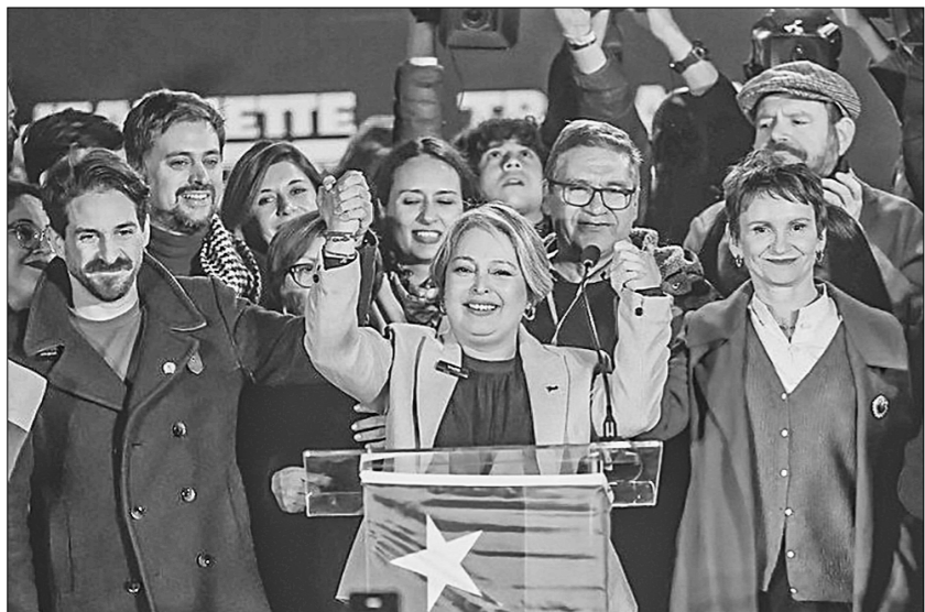
Бывший министр труда Чили коммунист Жанетт Хара с удивительной лёгкостью одержала победу на первичных праймериз левых партий, проведённых в стране перед предстоящими президентскими выборами, обойдя более умеренного соперника по коалиции, отмечает «Гардиан».

В чём же, спрашивается, более умеренного? Сие британская буржуазная газета ели и посягает, то весьма туманно. Разумеется, в отстаивании социальных прав и интересов трудового народа Чили. А как раз этим, в отличие от остальных претендентов левого блока, состоящего из 13 партий, Жанетт и сильна. Она была министром труда и социального обеспечения в правительстве Габриэля Борича, а в апреле ушла в отставку,