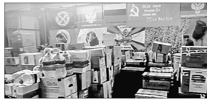
конвоя — это не просто передача необходимых вещей, а проявление настоящей соли-

дарности и братства. Коммунисты Нижегородской области, как и вся партия, дей-