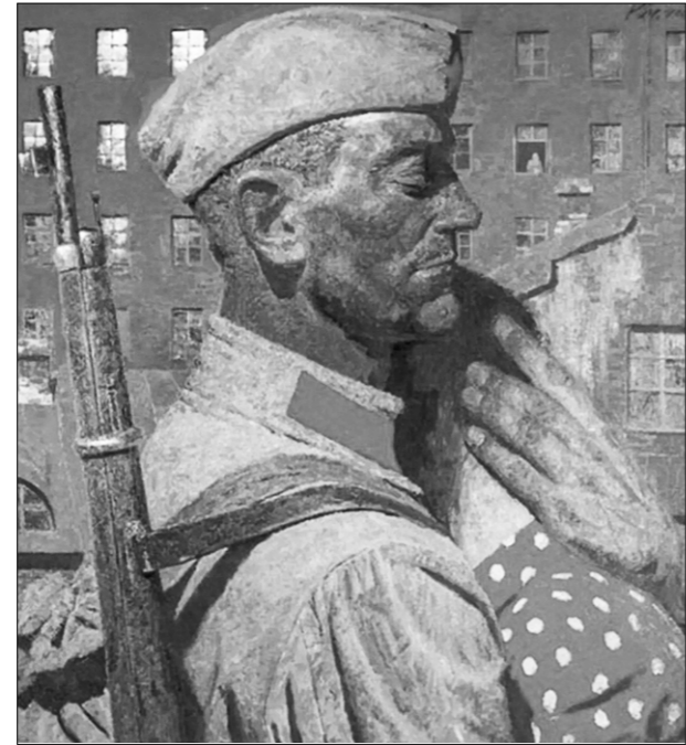
Г. Коржев. «Проводы».